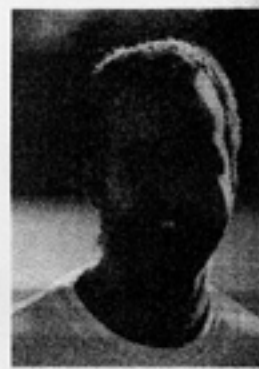
GAIO ■ ■ Salvador - BA, 1971