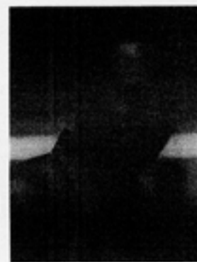
ELDER ROCHA ■ ■ Goiania - GO, 1961