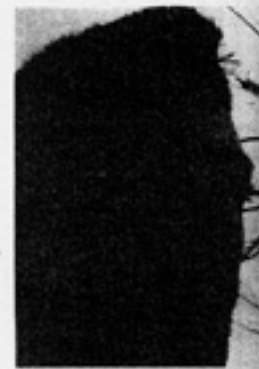
GUSTAVO GODOY ■ ■ São Paulo - SP, 1975